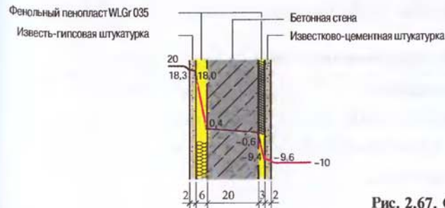
Рис. 2.67. Состав стены.

Пример 7. Как пример 6, но с более толстым слоем утеплителя внутри.