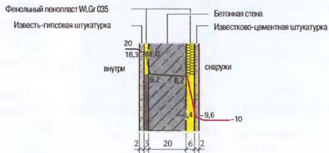
Рис. 2.65. Состав стены.

Пример 6. Бетонная стена с утеплителем с обеих сторон слоями разной толщины.